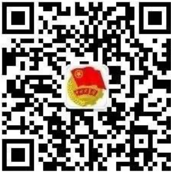
江苏开放大学（江苏城市 职业学院）团委