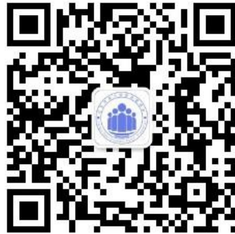
江苏开放大学（江苏城市 职业学院）校友联谊会