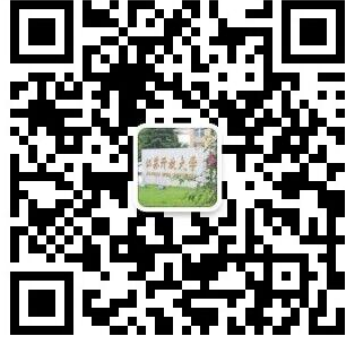
江苏开放大学（江苏城市 职业学院）学工处