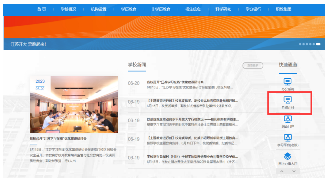
图 1-1 学校首页

打开江苏开放大学官网首页，点击右侧“月明在线”如图 1-1，或打开浏览器，输入网址： http://xuexi.jsou.cn/jxpt-web/index ，进入登录页面，如图 1-2。